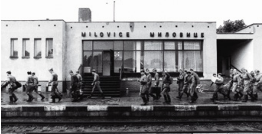
Trvalo 23 let, než sovětské okupační jednotky, čítající desítky tisíc mužů, konečně odtáhly. K posledním odjíždějícím vojákům patřili příslušníci velké posádky v Milovicích.

svým představitelům věří. Moskva počítala s tím, že v zemi ustaví loutkovou kolaborantskou „dělnicko-rolnickou vládu“, což se ukázalo jako nereálné. K tomu bylo nutno připočíst i jednoznačný odpor, který operace Dunaj vyvolala ve světě.