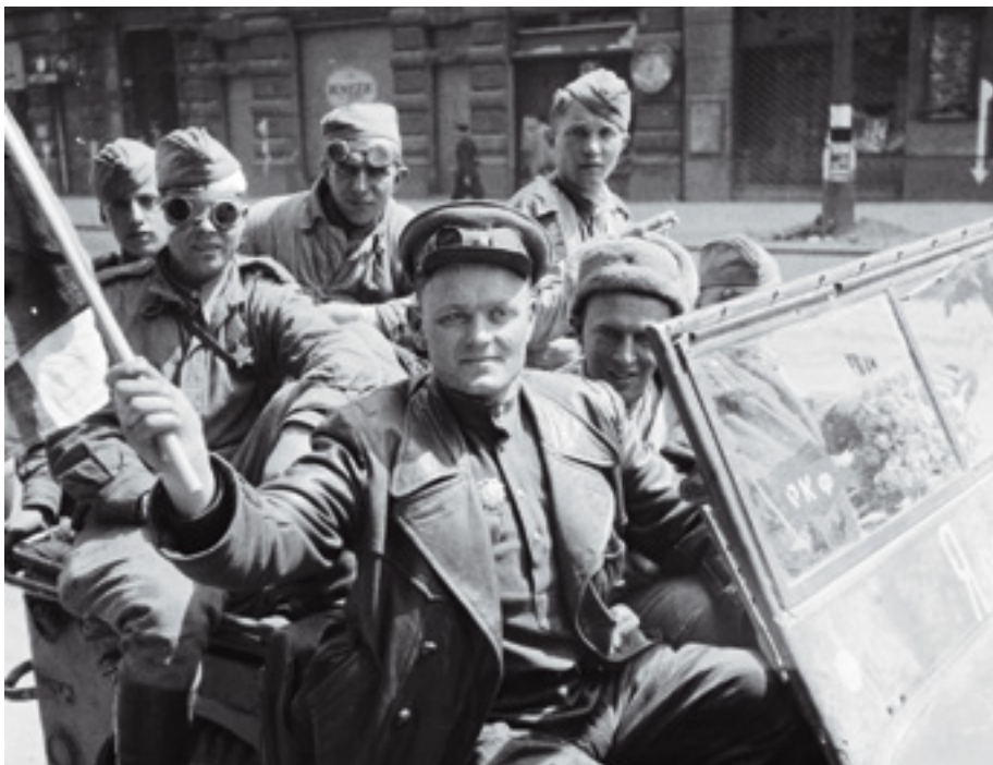
Příjezd rudoarmějců do Prahy. 9. 5. 1945