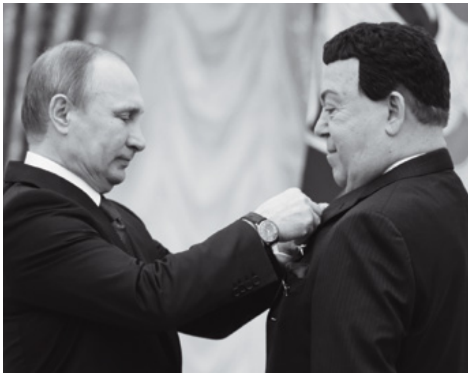
Hrdina práce Ruské federace (vpravo)

Vraťme se teď k Josifu Kobzonovi. Roku 2004 přijel do Karlových Varů a dva měsíce se zdržel v domě, který patřil moskevskému starostovi Juriji Lužkovovi. Podle informací ze zdrojů BIS i policie se sledovaný Kobzon během té doby sešel s Rusy podezřelými v Česku z praní špinavých peněz, se čtyřmi českými podnikateli a také s několika zaměstnanci ambasády, z nichž dva byli považováni za představitele tajných služeb. Podle neoficiálního názoru českých úřadů Kobzon tehdy vyjednával nákup nemovitostí v ČR (především v Praze a okolí) a také jednal o možném vstupu ruského kapitálu do Českých drah, přesněji řečeno o privatizaci jejich části.