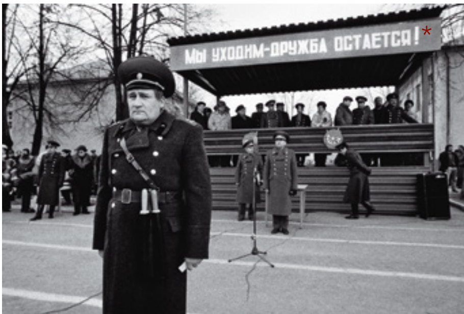
*My odcházíme – přátelství zůstává!